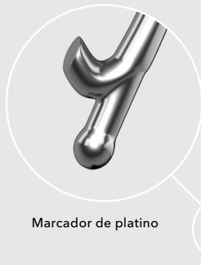
Marcador de platino

Eficaz para prevenir la EP y, al mismo tiempo, altamente recuperable. 1